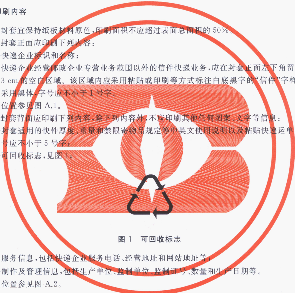
图 1 可回收标志